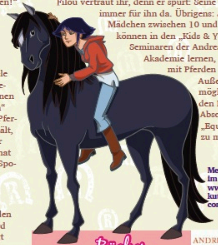
Mehr Infos gibt's im Internet unter www.andrea-kutschakademie.com

Außerdem ist es möglich, dort den Bachelor-Abschluss zum „Equine Coach“ zu machen.