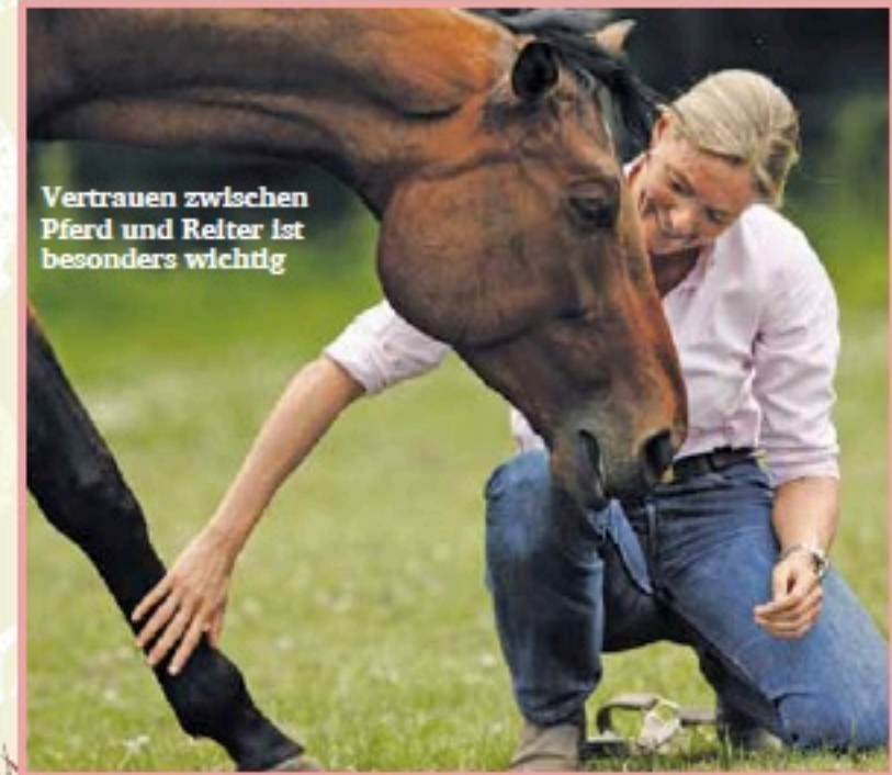
Vertrauen zwischen Pferd und Reiter ist besonders wichtig