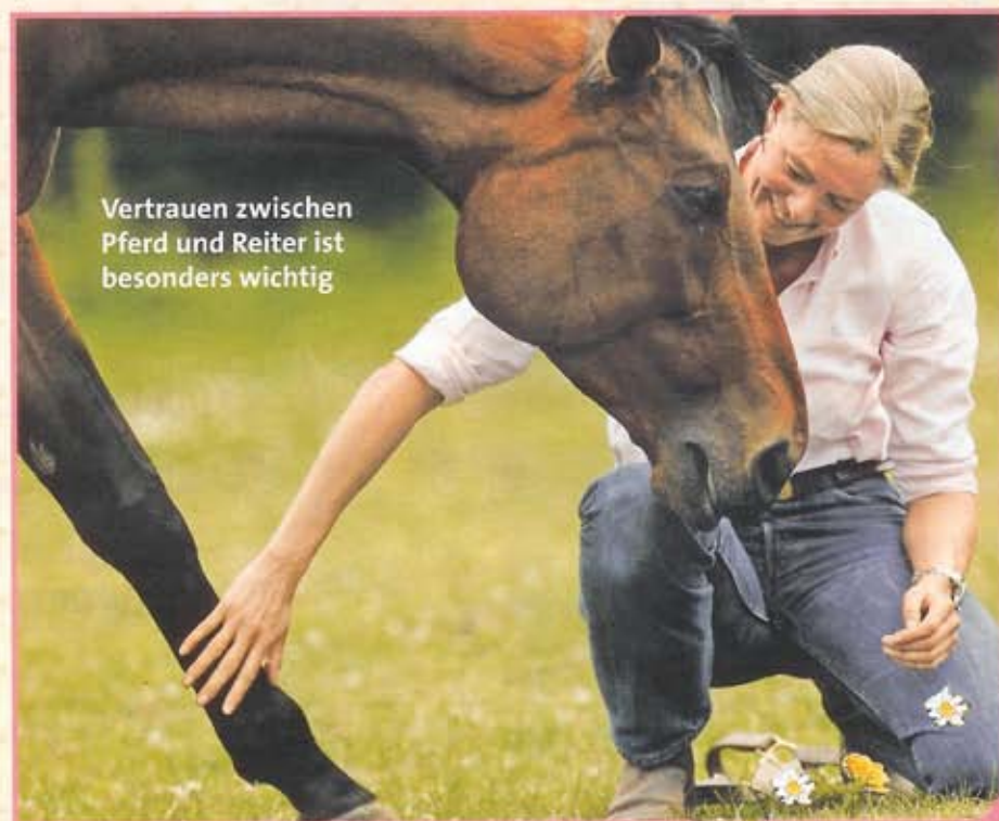
Vertrauen zwischen Pferd und Reiter ist besonders wichtig